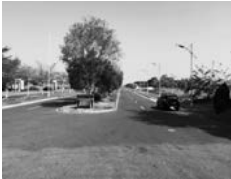
仁蘭園が進出している農業団地の様子