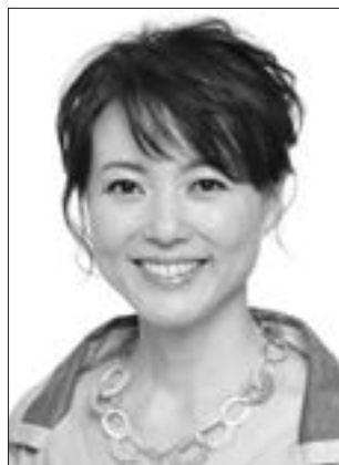
女優 杉田 かおる

すぎた かおる 7歳の時「パパと呼ばないで」(NTV系)に出演し子役デビュー。中学生時代に出演したドラマ「3年B組金八先生」(TBS系)で妊娠する中学生を演じ大きな話題となる。歌唱力にも定評がある。女優業の他にもバラエティー番組に出演し人気を博すなど多才ぶりを発揮している。健康、農業に興味を持ち、自然農にも造詣が深い。