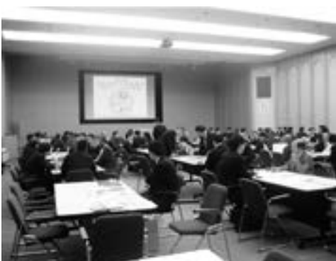
異業種交流や新規事業への相談の場となった交流会

交流会では交流ブースと新規事業への相談ブースを設置。活発な意見交換が行われ、「新規事業への糸口がつかめました」などの感想が寄せられました。（岡山支店）