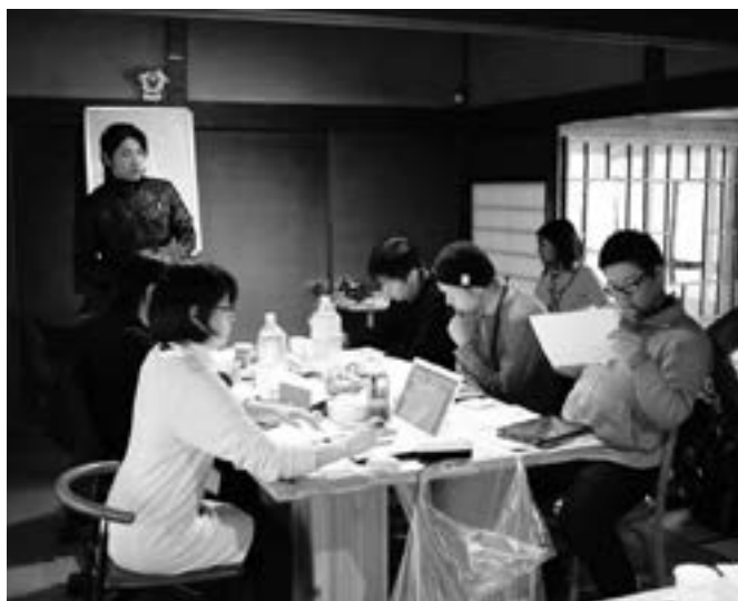
上：ボランティア派遣で農村に滞在する大学生 下：企画を打ち合わせる大学生

ボランティア事務局事業」を受託運営している。この事業によりサービス提供エリアが拡大し、派遣予算の確保をできたため派遣人数も増えた。〇六年から名称を「農村一六きつぷプロジェクト」としており、現在、二九集落へ年間約五〇〇人の学生を派遣している。ボランティアに参加するのは、主に鳥取大学農学部で、彼らが全体の多くを占めている。 若者たちの元気をおくる活動の目標に一步近づいたと思っている。