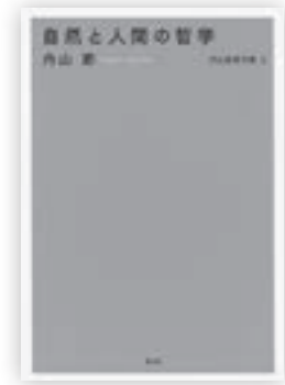
(農山漁村文化協会・2,900円 税抜)